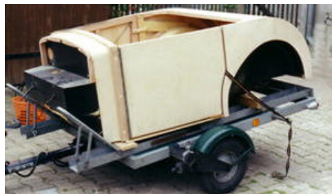
Fertig zur Montage auf das Chassis

Stellmacherei U. Thiede Geiliggasse 60a 99958 Bugtonna / Thüringen Tel. 036042 - 789 49 E-mail: Thiede@holzkarosserie.de