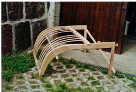
So fängt alles an ...