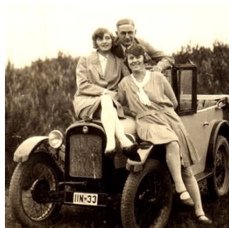
Also bis September in Eisenach !

In diesem Jahr findet in Eisenach ein großes Dixi Treffen unter Federführung des Automobilbauvereins Eisenach e. V. an historischer Stätte und aus Anlass „80 Jahre Dixi DA 1“ statt.