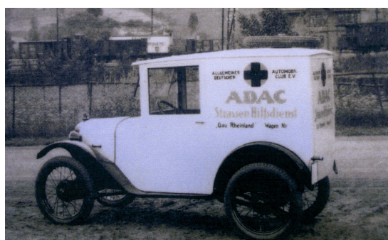
Der kleine Dixi als Lizenzausgabe aus Eisenach

Auch bei den damals üblichen Gebrauchs- und Wirtschaftlichkeitsfahrten stellten dir kleinen Dixi Wagen ihre Zuverlässigkeit unter Beweis und verbuchten etliche Erfolge in ihrer Klasse.