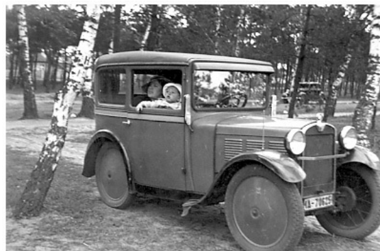
Der DA 2 aus Berlin Johannisthal

So wurde nach dem Vorbild von Rosengart bei Ambi-Budd in Berlin Johannisthal die Karosserie in Ganzstahlbauweise ausgeführt und eine Vierradbremse eingeführt.